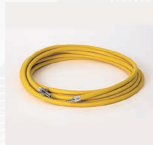
製品コード: 05-100-0770 パイピングホース空気ピン方式