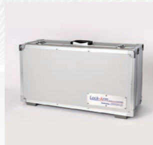
製品コード: 07-700-0720 ジュラルミン製ケース