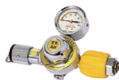
製品コード: 07-700-0301 調整器(ポンペ用) 空気シュレーダー方式