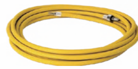
製品コード: 05-100-0780 パイピングホース8m 空気シュレーダー方式