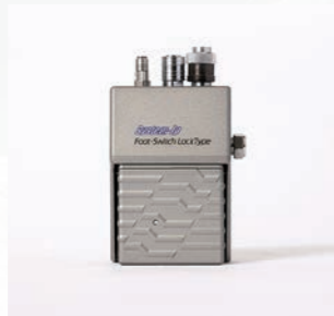
製品コード: 05-200-0800 ロック付きフットスイッチ