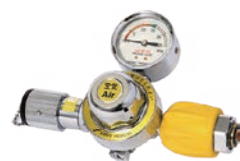
製品コード: 07-700-0300 調整器(ポンペ用)空気ピン方式