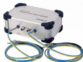
製品コード: 07-200-0220 ダブルフットスイッチ ユニット ※1台のロックアームを2台のフット スイッチで操作