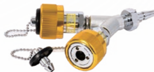
製品コード: 07-700-0310 2又アウトレット 空気ピン方式