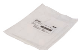
製品コード: 10-100-0300 ロックアームカバー(滅菌済) PP-F-20X-01 20枚入り