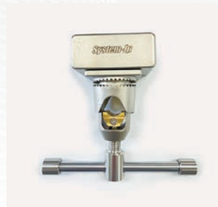
製品コード: 05-200-0870 レール固定金具