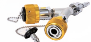
製品コード: 07-700-0320 2又アウトレット 空気シュレーダー方式